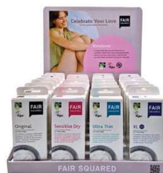
FAIR SQUARED KONDOME CLASSIC DISPLAY

10 STK., ART.-NR. 4910659 EAN 4262358580290