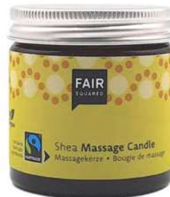
MASSAGE CANDLE SHEA 50 ML TIEGEL, ART.-NR.: 4910166 EAN: 4260365851877