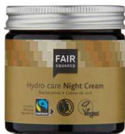
HYDRO CARE NIGHT CREAM

30 ML TRAVELSIZE ART.-NR.: 4910672 EAN: 4262358581327 50 ML TIEGEL ART.-NR.: 4910087 EAN: 4260365851976 1000 ML FLASCHE ART.-NR.: 4910728 EAN: 4262358581402