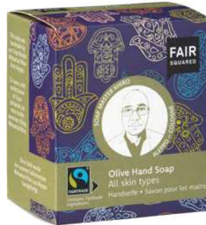
HAND SOAP OLIVE 160 G, ART.-NR.: 4910450 EAN: 4260365857855