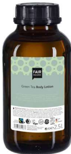
BODY LOTION GREEN TEA 2500 ML COSMETAINER ART.-NR. 4910493 EAN 4260663810873