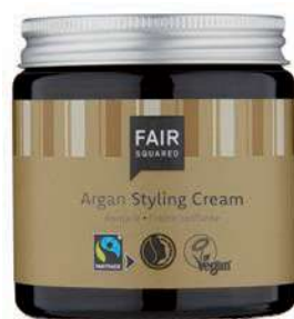
STYLING CREAM ARGAN

500 ML FLASCHE, ART.-NR.: 4910224 EAN: 4260365855325 2500 ML COSMETAINER, ART.-NR.: 4910473 EAN: 4260663810804