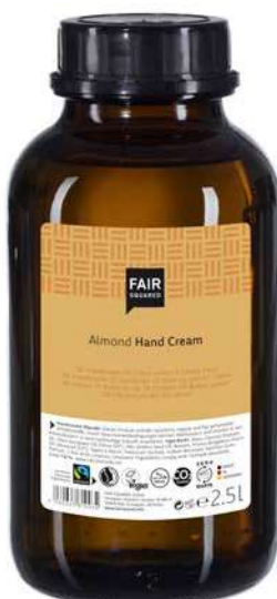
HAND CREAM ALMOND 2500 ML COSMETAINER ART.-NR. 4910495 EAN 4260663810934