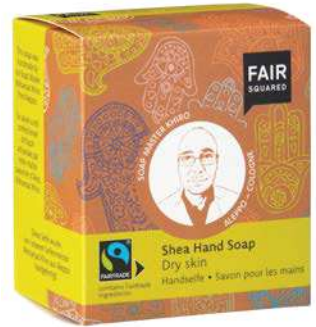
HAND SOAP SHEA, DRY SKIN 160 G, ART.-NR.: 4910452 EAN: 4260365857879