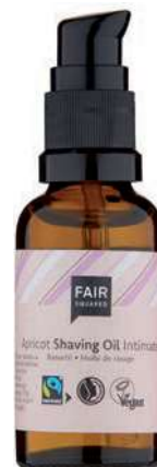
SHAVING OIL INTIMATE 30 ML FLASCHE ART.-NR.: 4910329 EAN: 4260365851037