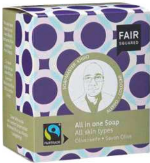
ALL IN ONE SOAP 160 G, ART.-NR.: 4910210 EAN: 4260365851662