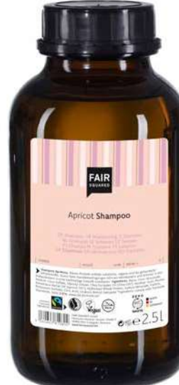
SHAMPOO APRICOT 2500 ML COSMETAINER ART.-NR. 4910473 EAN 4260663810804