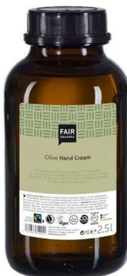
HAND CREAM OLIVE 2500 ML COSMETAINER ART.-NR. 4910487 EAN 4260663810941