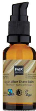
AFTER SHAVE BALM ARGAN 30 ML FLASCHE ART.-NR.: 4910486 EAN: 4260663810026