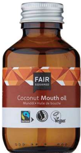
MUNDÖL COCONUT 100 ML FLASCHE, ART.-NR.: 4910324 EAN: 4260365857206