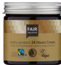
HYDRO PROTECT 24 HOURS CREAM

30 ML TRAVELSIZE ART.-NR.: 4910671 EAN: 4262358581310 50 ML TIEGEL ART.-NR.: 4910191 EAN: 4260365854748