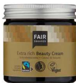
EXTRA RICH BEAUTY CREAM

30 ML TRAVELSIZE ART.-NR.: 4910673 EAN: 4262358581334 50 ML TIEGEL ART.-NR.: 4910140 EAN: 4260365850580 1000 ML FLASCHE ART.-NR.: 4910729 EAN: 4262358581426