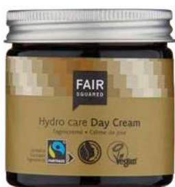
HYDRO CARE DAY CREAM

Die FAIR SQUARED Day Cream ist die feuchtigkeitsspendende und vitalisierende Gesichtspflege für jeden Tag. Das wertvolle Arganöl schützt vor Austrocknung und Alltagsbelastungen. Das Aprikosenkernöl und Aloe Vera unterstützen den Feuchtigkeitshaushalt der Haut nachhaltig. Die Day Cream ist besonders sanft, zieht schnell ein, fettet nicht und ist für alle Hauttypen geeignet.