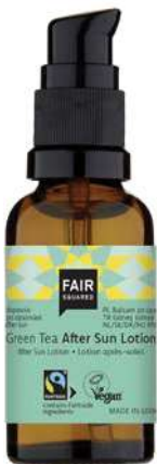
AFTER SUN LOTION GREEN TEA 30 ML FLASCHE ART.-NR.: 4910575 EAN: 4260365859729