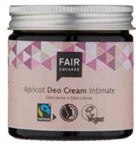
INTIMATE DEODORANT CREAM 50 ML TIEGEL, ART.-NR.: 4910285 EAN: 4260365852072