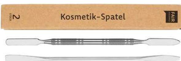
KOSMETIK-SPATEL DUO ART.-NR.: 4910360, EAN: 4260365858531