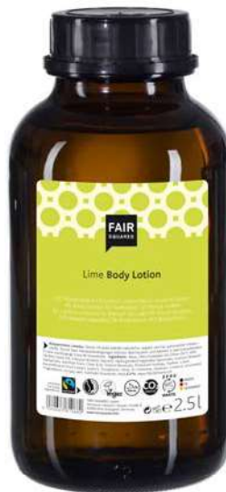
BODY LOTION LIME 2500 ML COSMETAINER ART.-NR. 4910481 EAN 4260663810880