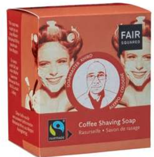
SHAVING SOAP COFFEE

160 G, ART.-NR.: 4910334 EAN: 4260365857381