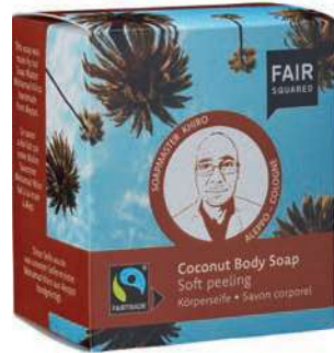
BODY SOAP COCONUT SOFT PEELING 160 G, ART.-NR.: 4910270 EAN: 4260365856032