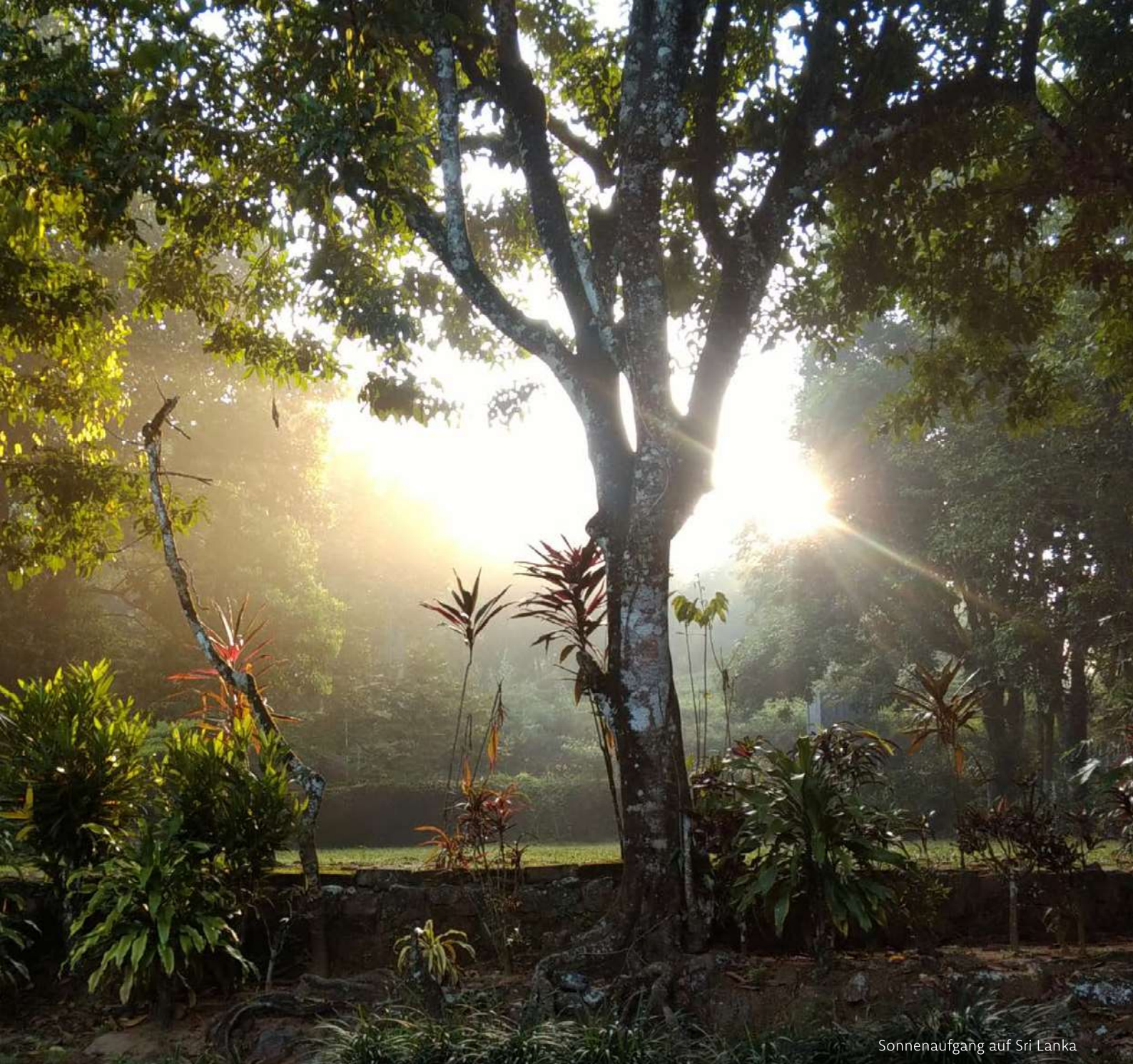
Sonnenaufgang auf Sri Lanka