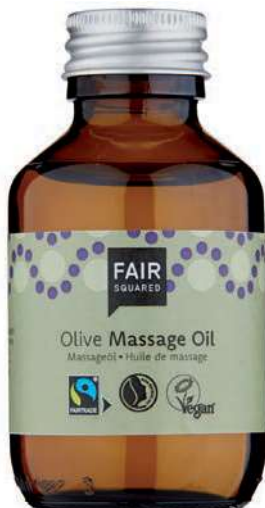
MASSAGE OIL OLIVE 100 ML FLASCHE, ART.-NR.: 4910298 EAN: 4260365855264