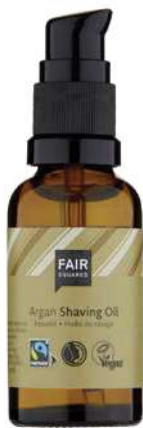
SHAVING OIL ARGAN 30 ML FLASCHE ART.-NR.: 4910330 EAN: 4260365851181