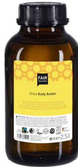
BODY BUTTER SHEA 2500 ML COSMETAINER ART.-NR. 4910484 EAN 4260663810910