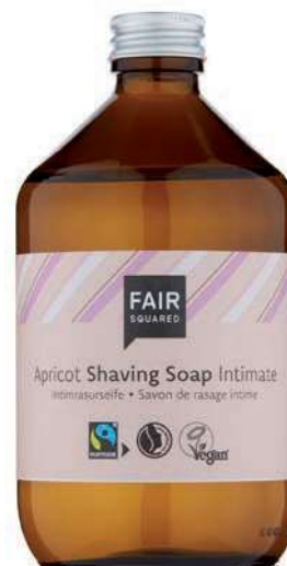
SHAVING SOAP INTIMATE 100 ML FLASCHE, ART.-NR.: 4910462 EAN: 4260663810187