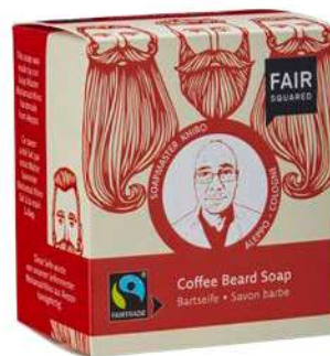
BEARD SOAP COFFEE

100 ML TIEGEL, ART.-NR.: 4910296 EAN: 4260365853796 1000 ML FLASCHE ART.-NR.: 4910732 EAN: 4262358581457