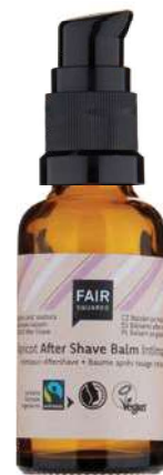
AFTER SHAVE BALM INTIMATE 30 ML FLASCHE ART.-NR.: 4910485 EAN: 4260663810019