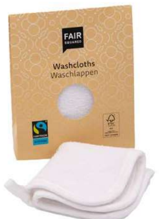
BAUMWOLL-WASCHLAPPEN 2 STÜCK, ART.-NR.: 4910295 EAN: 4260365853772