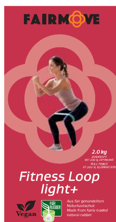
FITNESS LOOP LIGHT + 30 x 5 CM, ROT ART.-NR. 4800050 EAN 4262358581846