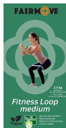
FITNESS LOOP MEDIUM 30 x 5 CM, GRÜN ART.-NR. 4800051 EAN 4262358581853