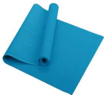
YOGAMATTE PETROL ART.-NR.: 4800196 EAN:: 4260365857664