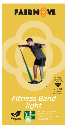
FITNESSBAND LIGHT 200 x 12 CM, GELB ART.-NR. 4800018 EAN: 4260365859187