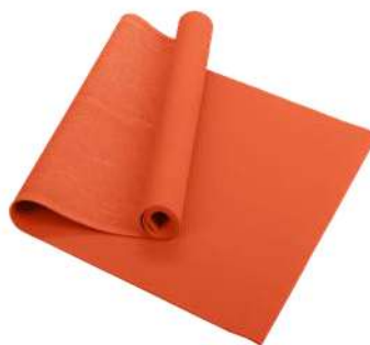
YOGAMATTE ORANGE ART.-NR.: 4800288 EAN:: 4260365859408