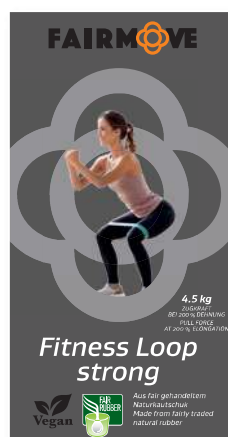
FITNESS LOOP STRONG 30 x 5 CM, SCHWARZ ART.-NR. 4800056 EAN 4262358581877