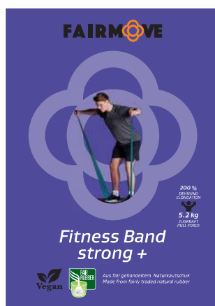
FITNESSBAND STRONG + 200 x 12 CM, LILA ART.-NR. 4800022 EAN: 4262358580894