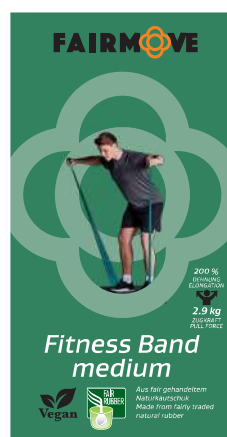
FITNESSBAND MEDIUM 200 x 12 CM, GRÜN ART.-NR. 4800020 EAN: 4260365859200