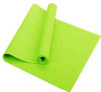
YOGAMATTE GREEN ART.-NR.: 4800065 EAN:: 4260663813003