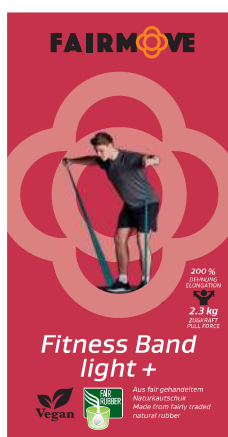
FITNESSBAND LIGHT + 200 x 12 CM, ROT ART.-NR. 4800019 EAN: 4262358580870