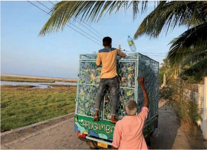
Einsammeln von Plastikflaschen: Upcycling-Projekt auf Sri Lanka