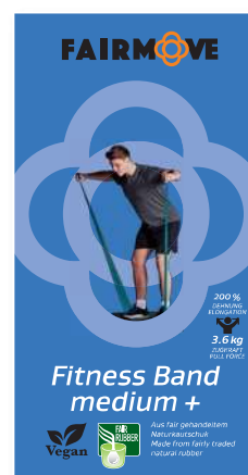
FITNESSBAND MEDIUM + 200 x 12 CM, BLAU ART.-NR. 4800021 EAN: 4262358580887