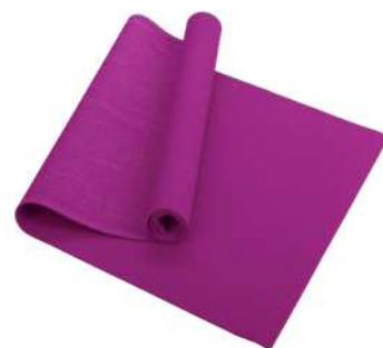
YOGAMATTE PURPLE ART.-NR.: 4800195 EAN:: 4260365857640