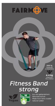
FITNESSBAND STRONG 200 x 12 CM, SCHWARZ ART.-NR. 4800024 EAN: 4260365859163