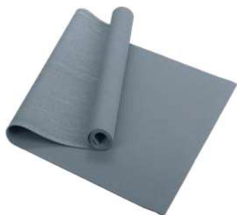
YOGAMATTE HELLGRAU ART.-NR.: 4800197 EAN:: 4260365857688