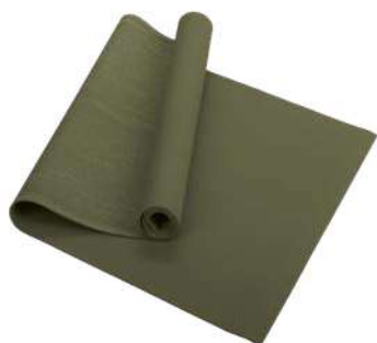
YOGAMATTE OLIVE ART.-NR.: 4800289 EAN:: 4260365859422