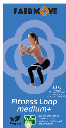
FITNESS LOOP MEDIUM + 30 x 5 CM, BLAU ART.-NR. 4800052 EAN 4262358581860