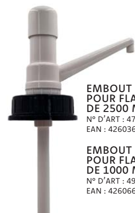
EMBOUT DE POMPE POUR FLACON EN VERRE DE 2500 ML N° D'ART : 4750284 EAN : 4260365859811