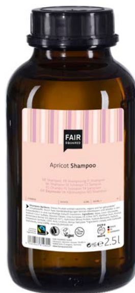
SHAMPOO APRICOT 2500 ML COSMETAINER N° D'ART : 4910473 EAN : 4260663810804