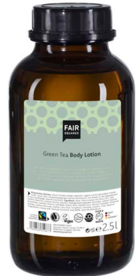
BODY LOTION GREEN TEA 2500 ML COSMETAINER N° D'ART : 4910493 EAN : 4260663810873