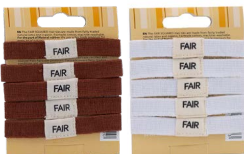
ÉLASTIQUES POUR CHEVEUX

Avec ces élastiques à cheveux en coton bio et en caoutchouc issu du commerce équitable, les cheveux sont parfaitement posés. Sans points de pression et avec une flexibilité maximale de la coiffure. Les élastiques sobres en coton sont particulièrement doux pour les cheveux.