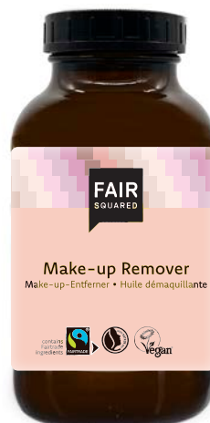
MAKE UP REMOVER 1000 ML COSMETAINER N° D'ART : 4910730 EAN : 4262358581433