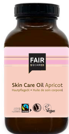
SKIN CARE OIL APRICOT 1000 ML COSMETAINER N° D'ART : 4910734 EAN : 4262358581488