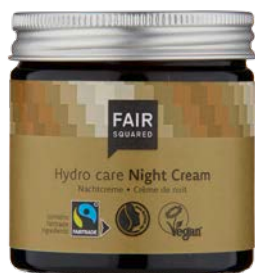
HYDRO CARE NIGHT CREAM

30 ML TAILLE VOYAGE N° D'ART : 4910672 EAN : 4262358581327 50 ML POT EN VERRE N° D'ART : 4910087 EAN : 4260365851976 1000 ML FLACON N° D'ART : 4910728 EAN : 4262358581402