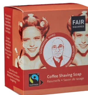
SHAVING SOAP COFFEE

160 G, N° D'ART : 4910334 EAN : 4260365857381