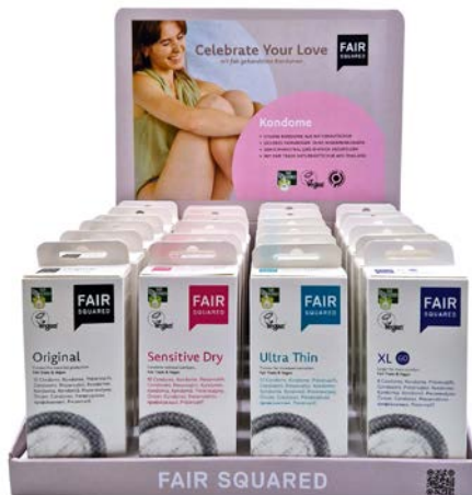
PRÉSENTOIR : PRÉSERVATIFS CLASSIC CONTENANCE 28 PCS., N° D'ART : 4950021 EAN: 4262358581204