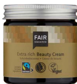
EXTRA RICH BEAUTY CREAM

30 ML TAILLE VOYAGE N° D'ART : 4910673 EAN : 4262358581334 50 ML POT EN VERRE N° D'ART : 4910140 EAN : 4260365850580 1000 ML FLACON N° D'ART : 4910729 EAN : 4262358581426