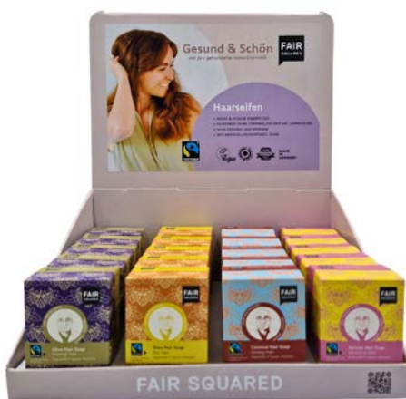
PRÉSENTOIR : SAVONS SOLIDES POUR CHEVEUX CONTENANCE 20 PC., N° D'ART : 4950013 EAN: 4262358581129