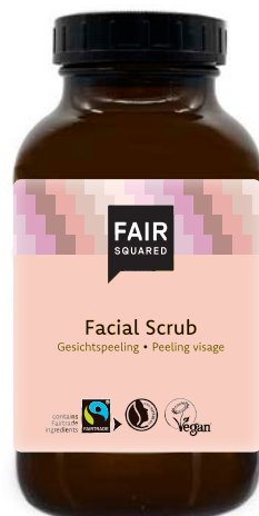
FACIAL SCRUB APRICOT 1000 ML COSMETAINER N° D'ART : 4910731 EAN : 4262358581440