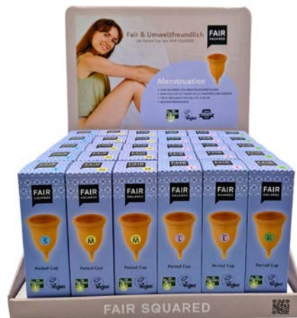
PRÉSENTOIR : MENSTRUATIONS CONTENANCE 30 PCS., N° D'ART : 4950022 EAN: 4262358581211