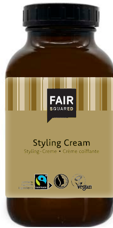
STYLING CREAM 1000 ML COSMETAINER N° D'ART : 4910732 EAN : 4262358581457