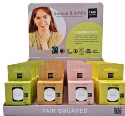
PRÉSENTOIR : SOINS DES LÈVRES CONTENANCE 40 PCS., N° D'ART : 4950008 EAN: 4262358581075