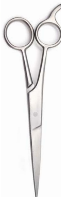
CYCLED STEEL CISEAUX À CHEVEUX

Les ciseaux à cheveux en acier recyclé pakistanais est conçu pour une coupe de cheveux précise et régulière. Grâce au crochet pour les doigts, ils tiennent parfaitement en main. Les deux anneaux de la poignée symétriquement superposés permettent une sensation de coupe traditionnelle. Le petit doigt peut être posé confortablement sur le crochet du doigt, ce qui permet de manier le ciseau de manière sûre. Les ciseaux de coiffeur peuvent être utilisés en toute sécurité. Qu'il s'agisse de raccourcir une frange ou de couper des fourches, ces ciseaux de coiffeur sont un compagnon à vie.