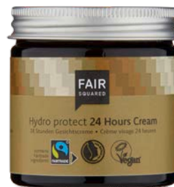
HYDRO PROTECT 24 HOURS CREAM

30 ML TAILLE VOYAGE N° D'ART : 4910671 EAN : 4262358581310 50 ML POT EN VERRE N° D'ART : 4910191 EAN : 4260365854748