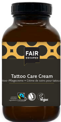
TATTOO CARE CREAM 1000 ML COSMETAINER N° D'ART : 4910733 EAN : 4262358581464