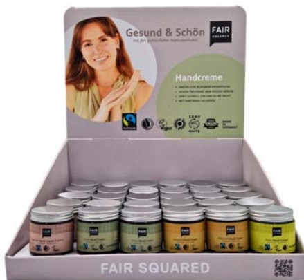
PRÉSENTOIR : SOINS DES MAINS CONTENANCE 30 PCS., N° D'ART : 4950007 EAN: 4262358581068