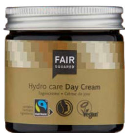
HYDRO CARE DAY CREAM

Soin de jour pour le visage, hydratant et vitalisant. L'huile d'argan précieuse protège du dessèchement de la peau et des agressions du quotidien. L'huile d'argan possède un taux élevé en vitamine E qui protège de l'action néfaste des radicaux libres. Avec l'huile de noyau d'abricot et l'aloé vera, elle protège la peau.