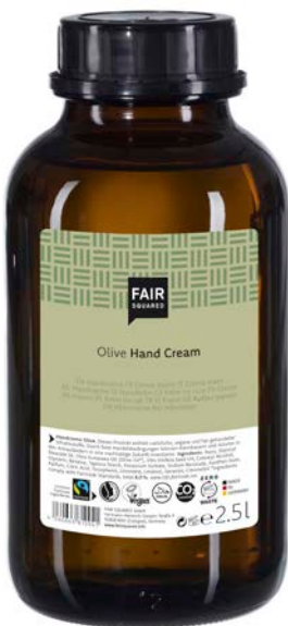
HAND CREAM OLIVE 2500 ML COSMETAINER N° D'ART : 4910487 EAN : 4260663810941