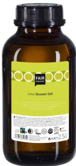
SHOWER GEL LIME 2500 ML COSMETAINER N° D'ART : 4910477 EAN : 4260663810842