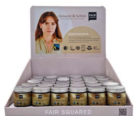
PRÉSENTOIR : SOINS DU VISAGE CONTENANCE 30 PCS., N° D'ART : 4950009 EAN: 4262358581082