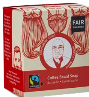
BEARD SOAP COFFEE

1000 ML FLACON N° D'ART : 4910732 EAN : 4262358581457