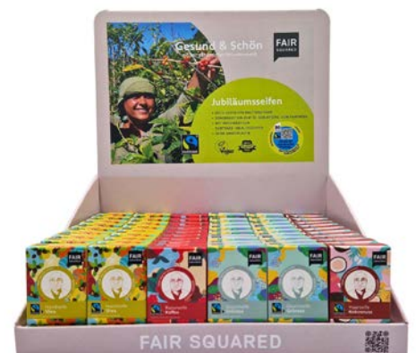
PRÉSENTOIR : SAVONS FAIRTRADE CONTENANCE 60 PCS., N° D'ART : 4950010 EAN: 4262358581099