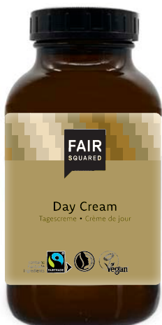
DAY CREAM 1000 ML COSMETAINER N° D'ART : 4910728 EAN : 4262358581402