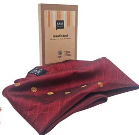
BANDEAUX POUR LES CHEVEUX

4ER-SET: N° D'ART : 4910545 EAN : 4260663811177