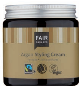
STYLING CREAM ARGAN

2500 ML COSMETAINER, N° D'ART : 4910473 EAN : 4260663810804